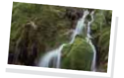
Puente de mayo